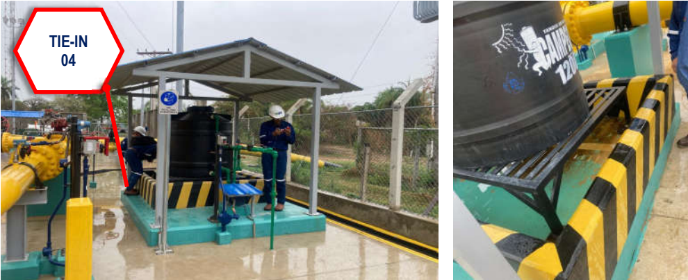
FOTOGRAFÍAS 5 INTERCONEXION 6