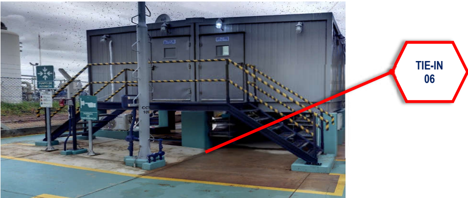
FOTOGRAFÍAS 6 INTERCONEXION 6