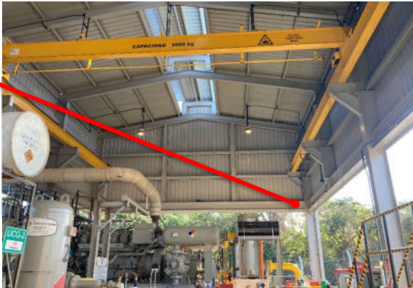
FOTOGRAFÍAS 2 INTERCONEXION 02; INTERCONEXION 008